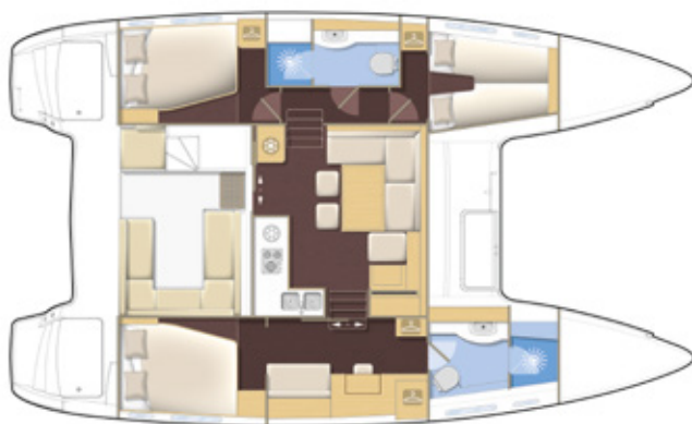
Version propriétaire, 2 salles d'eau Owner's version, 2 bathrooms

Comfort : equipped for long distance cruising, your Lagoon includes all the equipment required for a prolonged and distant cruise.