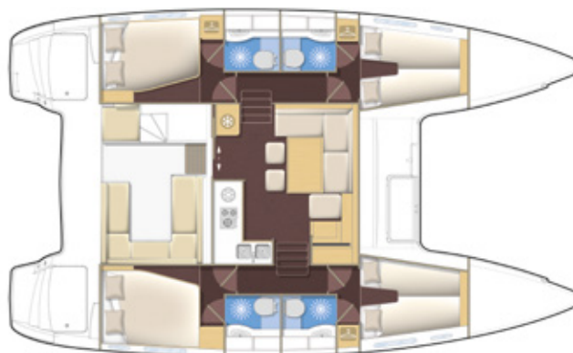
Version 4 cabines, 4 salles d'eau 4 cabin version, 4 bathrooms