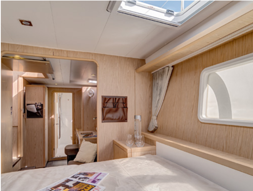
A tribord, la suite du propriétaire avec son sofa et son bureau attenant.

The owner's suite to starboard with its en suite sofa and desk.